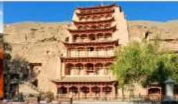
ต้าเถะสลิกม่อเถาสู