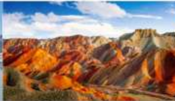
หุบเขาสายรุ้งจางเย่