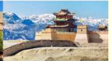
กำแพงเมืองจีน ด่านเจียยวี่กวน

*ทางบริษัทฯ ขอสงวนสิทธิ์ในการสลับโปรแกรมทัวร์ตามความเหมาะสมขึ้นอยู่กับสถานการณ์หน้างาน โดยคำนึงถึงผลประโยชน์ของลูกค้าเป็นสำคัญ