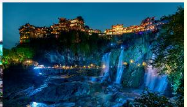
ฝูหลงเจิน

*ทางบริษัทฯ ขอสงวนสิทธิ์ในการสลับโปรแกรมทัวร์ตามความเหมาะสมขึ้นอยู่กับสถานการณ์หน้างาน โดยคำนึงถึงผลประโยชน์ของลูกค้าเป็นสำคัญ