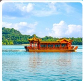
ล่องเรือทะเลสาบหลิวเยว่หู