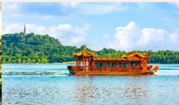
ล่องเรือทะเลสาบหลิวเยว่หู