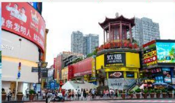
ถนนหวงซิงลู่