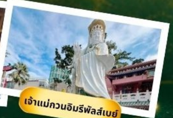
เจ้าแม่กวนอิมริฟลัสเปย์