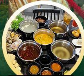
ซาบูฮ่องกง

02-04 มิ.ย. 18-20 มิ.ย. 07-09 มิ.ย. 20-22 มิ.ย. 13-15 มิ.ย. 25-27 มิ.ย. 14-16 มิ.ย. 28-30 มิ.ย.