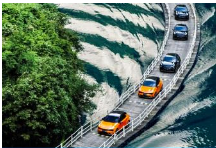
ถนนลอยน้ำด่านสิงโต