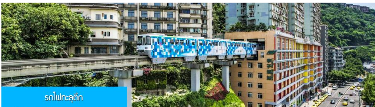
รถไฟทะเลตุ๊ก