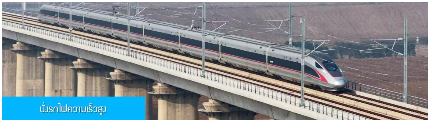
นั้รถไฟความเร็วสูง

รับประทานอาหารเช้า ณ ห้องอาหารของโรงแรม (10)