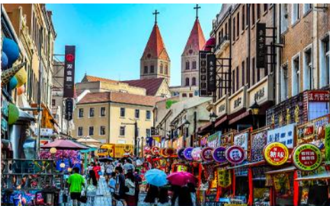
ถนนจงซาน