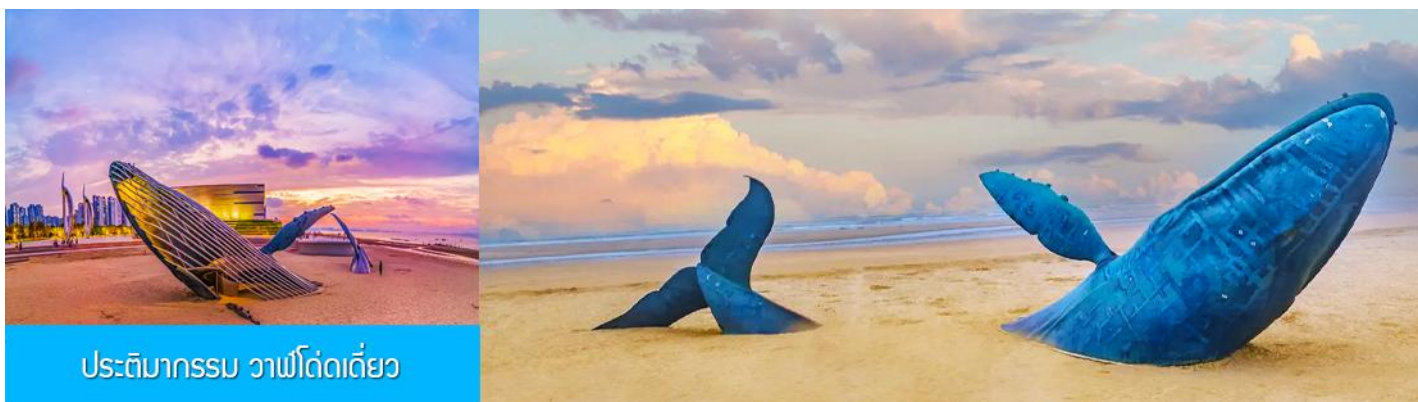
ประติมากรรม วาฬโศกเดี่ยว

หลังอาหารนำท่านเที่ยวชม ท่าเรือชาวประมงไห่ซาง 烟台海昌鱼人码头 ท่าเรือนี้เต็มไปด้วยสถาปัตยกรรมสไตล์อเมริกาเหนือ และยุโรป ให้ท่านได้สัมผัสและเก็บภาพบรรยากาศที่แสนโรแมนติกริมทะเล ที่มีอาคาร