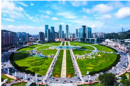
จัตุรัส星海

นำท่านเที่ยวชม ถนนญี่ปุ่น 日本风情街 เป็นอีกหนึ่งแหล่งช้อปปิ้งที่นักท่องเที่ยวไม่ควรพลาด ได้รับฉายาว่าเป็น เกียวโตน้อยแห่งราชวงศ์ถัง 盛唐小京都 ออกแบบโดยสถาปนิกชาวญี่ปุ่น และใช้วัสดุที่นำเข้ามาจากญี่ปุ่นในการก่อสร้าง ที่นี้ถูกเนรมิตให้กลายเป็น เมืองเกียวโตขนาดย่อม และเป็นจุดเช็คอิน ถ่ายภาพ สำหรับนักท่องเที่ยวสมัยใหม่..