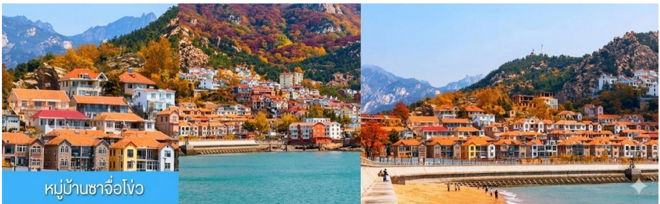
หมู่บ้านซาจื่อโ้ว

พักที่ WEIHAI BOYUE HOTEL / WEIHAI JIANGUO PUYIN โรงแรมระดับ 4 ดาวท้องถิ่นเมืองเวย์ไห่