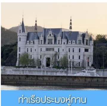
ท่าเรือประมงหู่กาน

พักที่ DALIAN JUZISHUIJING HOTEL / SANSHUI HOTEL โรงแรมระดับ 4 ดาวท้องถิ่น ต้าเหลียน