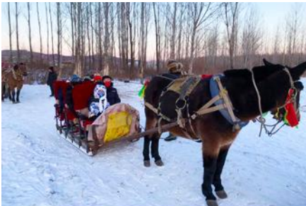
นั่งม้าลากเลื่อน

เที่ยง รับประทานอาหารกลางวัน ณ ภัตตาคาร (5)