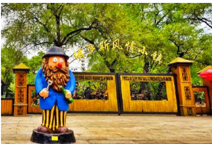
หมู่บ้านรัสเซีย

ตั้งอยู่บนเกาะพระอาทิตย์ 位于太阳岛上 เมื่อนักท่องเที่ยวมาเยือนในหมู่บ้านเสมือนท่านกำลังเดินเล่นอยู่ในหมู่บ้านหนึ่งใน รัสเซีย