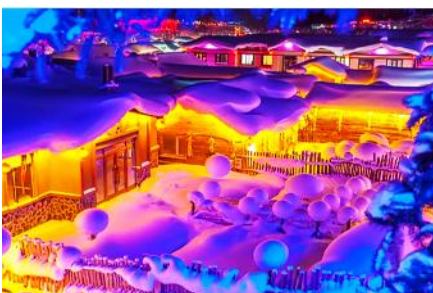
หมู่บ้านหิมะ Snow Town

ท่ามกลางท้องทุ่งและผืนป่าที่ปกคลุมด้วยหิมะราวกับอยู่ในโลกแห่งเทพนิยาย ผ่านหมู่บ้าน เวยหูจ้าย 威虎寨 ที่อดีตเคยเป็นที่ตั้งของรังโจรที่มักออกปล้นสะดมชาวบ้าน ม้าลากเลื่อนเป็นยานพาหนะเฉพาะพื้นที่ ๆ ที่นิยมนำมาใช้ในการเดินทางหรือลำเลียงสิ่งของในช่วงฤดูหนาว ที่ใช้ม้ามาลากจูงแคร่เลื่อนให้สามารถเคลื่อนย้ายบนลานหิมะได้