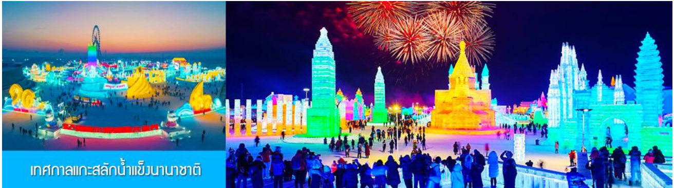
เทศกาลแกะสลักน้ำแข็งนานาชาติ

นำท่านชมและถ่ายภาพกับ รูปปั้นตุ๊กตาหิมะยักษ์ 网红大雪人 เป็นตุ๊กตาหิมะขนาดใหญ่ความสูง 18 เมตร ที่ทางเทศบาลเมืองฮาร์บินจัดทำขึ้นในช่วงฤดูหนาวของทุกปี เช่นเดียวกับการประดับต้นคริสมาสในช่วงเทศกาลของชาวตะวันตก จนกลายเป็นสัญลักษณ์แห่งฤดูหนาวของเมืองฮาร์บิน