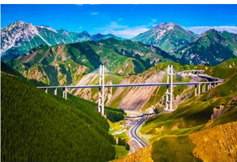
สะพานกั๋วจื่อโกว

หลังอาหารเช้าท่านเดินทางโดยรถบัสสู่ ตำบลนำลาถิ 那拉提 (ระยะทาง 300 กม. ใช้เวลาเดินทางราว 4 ชั่วโมง)