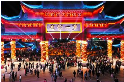
การแสดงชุด Dreaming Wudang