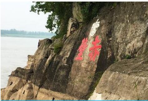
สมรภูมิมิผาแดง

พักที่ CHIBI HOTEL โรงแรมระดับ ดาวท้องถิ่นในเมืองชือปี้