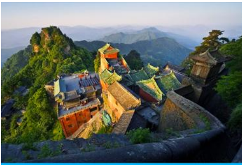
กระเช้าขึ้นเขาบู๊ตึง