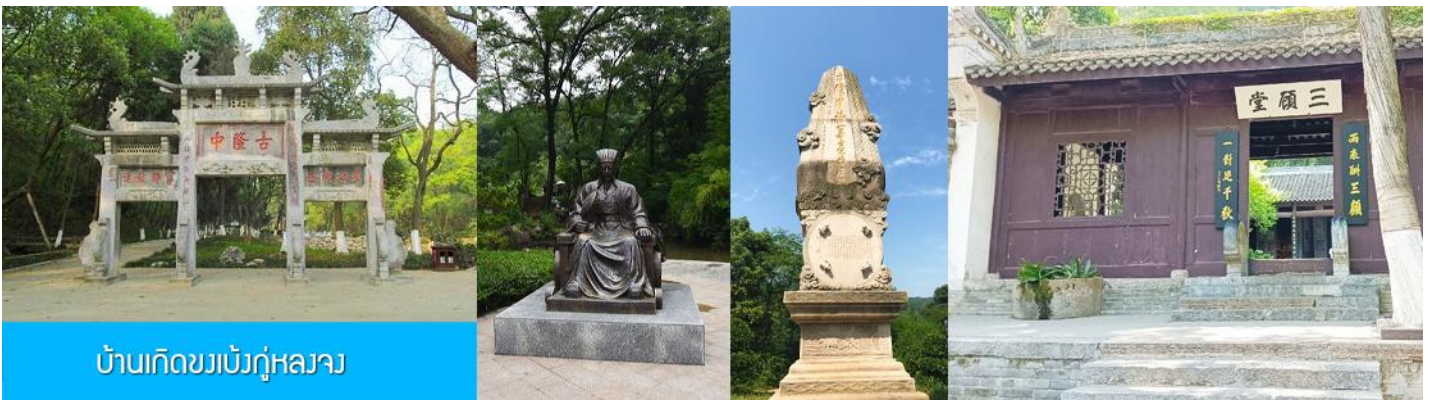
บ้านเกิดขงเบ้งกู่หลงจาง

พักที่ XIANGYANG MEIHAO HOTEL ระดับ 4 ดาวท้องถิ่นหรือเทียบเท่าในเมืองเซียงหยาง