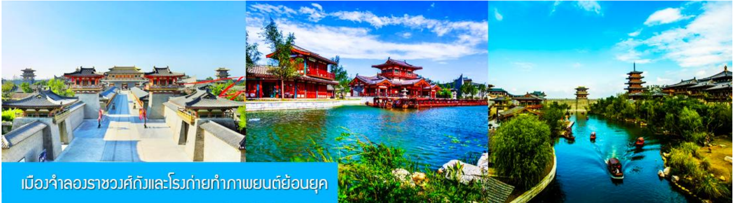
เมืองจำลองราชวงศ์ถังและโรงถ่ายทำภาพยนตร์ย้อนยุค