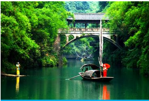
หมู่บ้านชาเบเลีย