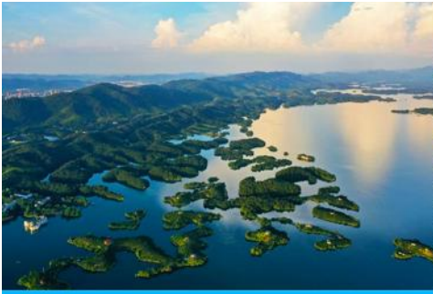
เมืองชือปี้