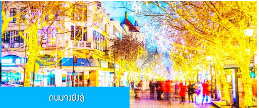
ถนนจงหยางต้า