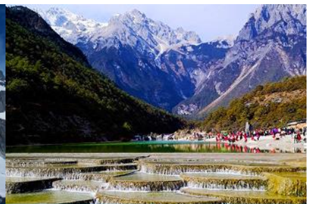
หุบเขาพระจันทร์สีน้ำเงิน "ไปสู่อุทยาน"

วันที่สี่ ภูเขาหิมะมังกรหยก (รวมนั่งกระเช้าใหญ่ขึ้นลง)– หุบเขาพระจันทร์สีน้ำเงิน-น้ำตกไปสู่อุทยานออฟชั่น ไกด์ขายรถกอล์ฟ ท่านละ 80 หยวน โชว์ IMPRESSION LIJIANG- อุทยานน้ำหยก -ต้าหลี่