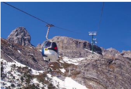
ภูเขาหิมะมังกรหยก (นั่งกระเช้าใหญ่)

ที่พัก FENG HUANG HOTEL ระดับ 4 ดาว หรือเทียบเท่าเมืองลี่เจียง