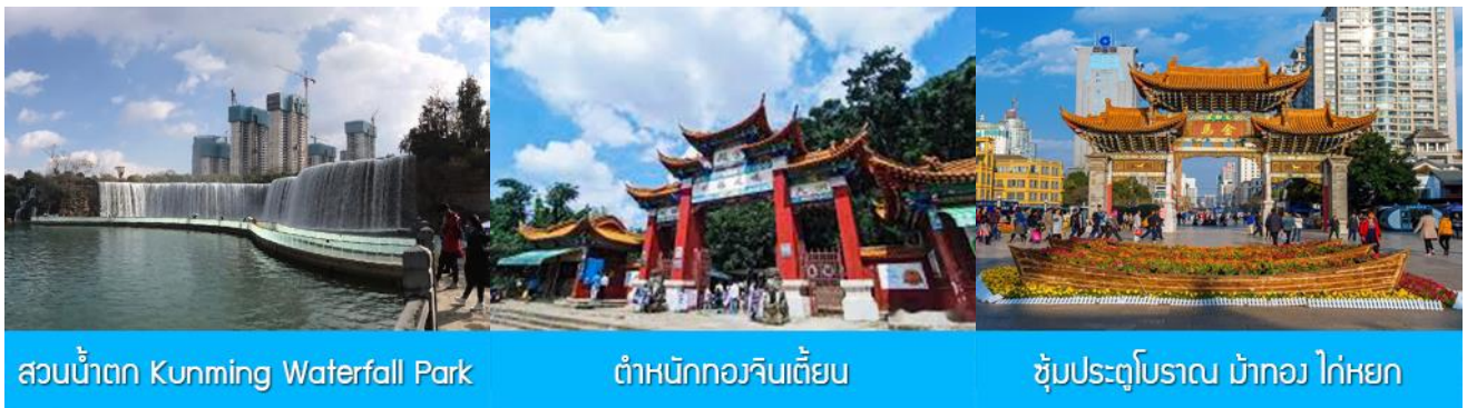
สวนน้ำตก Kunming Waterfall Park

พักที่ VIENNA HOTEL ระดับ 4 ดาว หรือเทียบเท่าในเมืองคุนหมิง