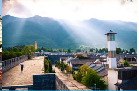
หมู่บ้านซีโจว(หมู่บ้านชาวปู้)