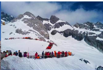
ภูเขาหิมะมังกรหยก