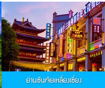
ย่านชุนเจียเหลียงเจียง