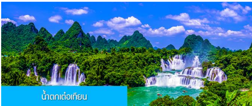
น้ำตกต่อเทียน