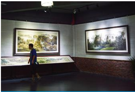
พิพิธภัณฑ์ภาพหินทราย