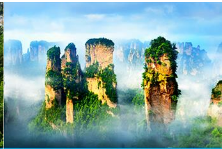
ภูเขาอวตาร