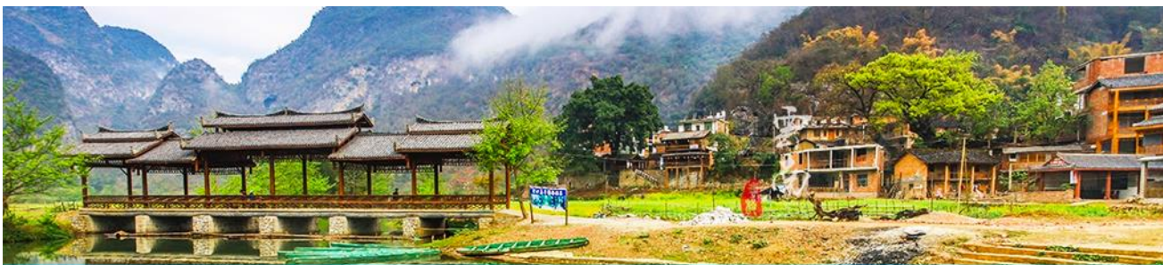
สวนดอกท้อ