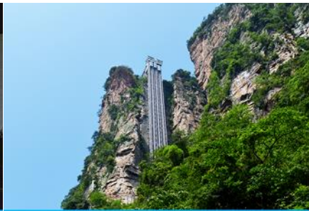
ลิฟท์แก้วไปหลาง