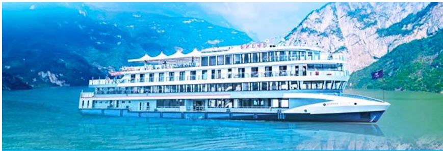
ล่องเรือชมเขื่อนสามผา