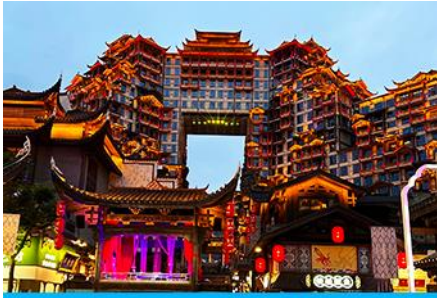
ตึกมหัศจรรย์ 72 ชั้น