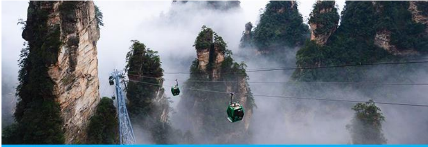
กระเช้าลงจากเขาเทียนจื่อซาน