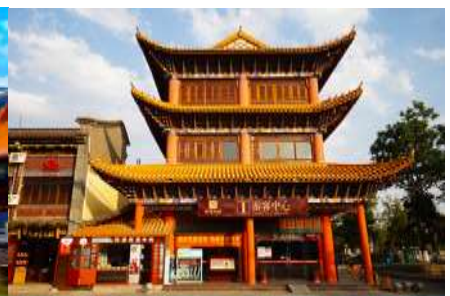
เมืองโบราณกวนตุ๋

วันที่ห้า เมืองต้าหลี่ – เมืองคุนหมิง-วัดหยวนทง-เมืองโบราณกวนตุ๋