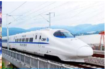
นิ้งรถไฟความเร็วสูง