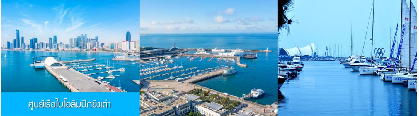
ศูนย์เรือใบโอลิมปิกชิงเต่า

จากนั้นนำท่านเที่ยวชม โรงเบียร์ชิงเต่า 青岛啤酒博物馆 พิพิธภัณฑเบียร์ที่ขึ้นชื่อของเมืองชิงเต่า ซึ่งเป็นเบียร์ยี่ห้อแรกที่ผลิตขึ้นในประเทศจีน ชมเบียร์ คอลเลกชันที่มียี่ห้อหลากหลายที่สุดของโลก และชมการจัดแสดงภาพและวิดิทัศน์เกี่ยวกับวิวัฒนาการของเบียร์ ขั้นตอนการผลิตและอื่น ๆ ที่เกี่ยวข้อง พร้อมชิมเบียร์ชิงเต่า ซึ่งเป็นเบียร์ที่ขายดีที่สุดในยี่ห้อหนึ่งของจีน.. (ชิมเบียร์ชิงเต่าท่านละ 1 แก้ว รับกลับอีก 1 ขวดเล็ก ตอนเดินออก)