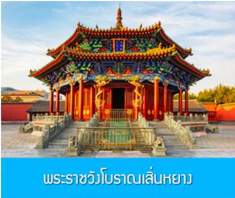
พระราชวังโบราณเสิ่นหยาง