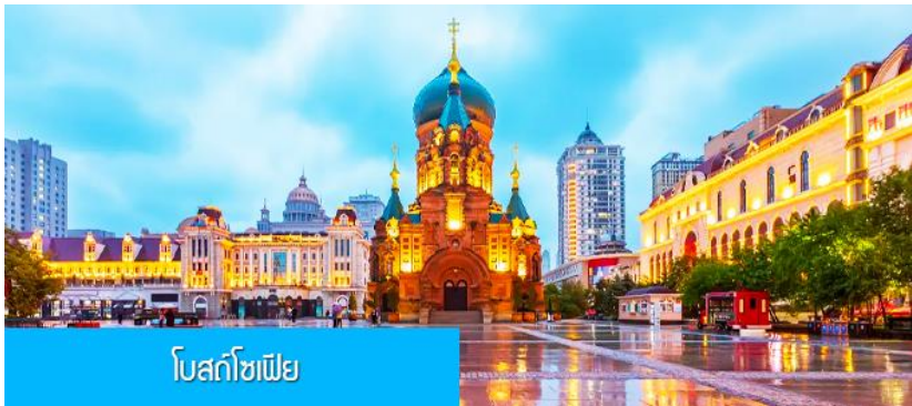
โบสถ์โฮเฟีย