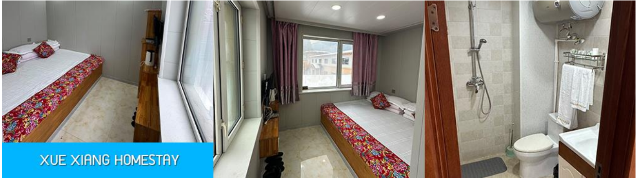
XUE XIANG HOMESTAY

ขยับแขนขาตามจังหวะดนตรี และเป็นเป็นจุดเช็คอินยอดนิยมสำหรับนักท่องเที่ยวผู้มาเยือน นอกจากนี้ที่นี่ยังมีร้านขายของที่ระลึก และร้านอาหาร แผงขายผลไม้แช่แข็ง และสินค้าพื้นเมืองต่าง ๆ มากมาย..