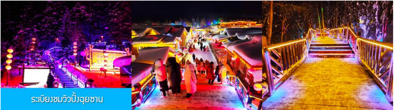
ระเบียงชมวิวยิ่งจู่ซาน

นำท่านสู่ระเบียงชมวิวยิ่งจู่ซาน 棒槌山观光栈道 เป็นระเบียงทางเดินชมวิวมุ่บ้านหิมะบนเนินที่ทำด้วยไม้ มีความยาว 3,200 เมตร ระเบียงทางเดินชมวิวนี้นี้ได้พาดผ่านจุดชมวิวยอดนิยม ต่าง ๆ ที่สามารถมองเห็นทัศนียภาพที่สวยงามของเมืองในเทพนิยายในมิติและมุมมองที่หลากหลาย เป็นที่นิยมของนักท่องเที่ยวที่ชื่นชอบการถ่ายภาพเป็นอย่างยิ่ง เพราะระเบียงทางเดินชมวิวมุมสวย ๆ ให้ถ่ายรูปตลอดเส้นทาง, เดินบนระเบียงไม้มีค่าใช้จ่ายใด ๆ ท่านสามารถเดินชมวิวดำตามอัธยาศัย จนอิ่มใจ