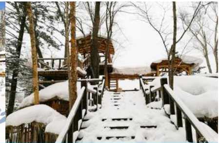
ระเบียงชมวิวยิ่งจู่ชาน

วันที่สาม เมืองฮาร์บิน-สถานีรถไฟฮาร์บิน-รวมนั่งม้าลากเลื่อน- หมู่บ้านหิมะ Xue xiang China Snow Town - ระเบียงชมวิวยิ่งจู่ชาน- ชมแสงสียามราตรีหมู่บ้านหิมะ-ชมพลุไฟและขบวนพาเหรดระบำพื้นเมือง-นอนในหมู่บ้านหิมะ Xue xiang