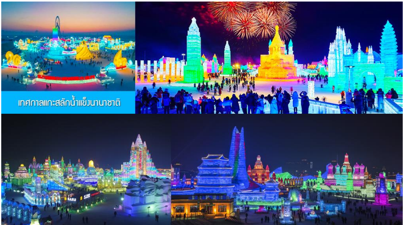
เทศกาลแกะสลักน้ำแข็งนานาชาติ

หลังอาหารนำท่านเดินทางโดยรถบัสสู่ เมืองฮาร์บิน ใช้ทางด่วนมอเตอร์เวย์กลับเข้าสู่ตัวเมืองฮาร์บิน