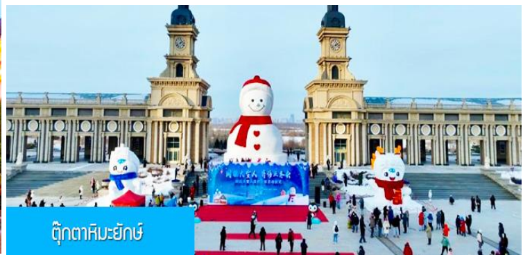
ตุ๊กตาหิมะยักษ์