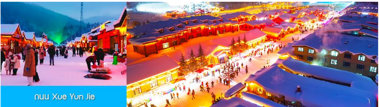
ถนน Xue Yun Jie

นำท่านสู่ระเบียงชมวิวยิ่งจู่ซาน 棒槌山观光栈道 เป็นระเบียงทางเดินชมวิวมุ่บ้านหิมะบนเนินที่ทำด้วยไม้ มีความยาว 3,200 เมตร ระเบียงทางเดินชมวิวนี้นี้ได้พาดผ่านจุดชมวิวยอดนิยม ต่าง ๆ ที่สามารถมองเห็นทัศนียภาพที่สวยงามของเมืองในเทพนิยายในมิติและมุมมองที่หลากหลาย เป็นที่นิยมของนักท่องเที่ยวที่ชื่นชอบการถ่ายภาพเป็นอย่างยิ่ง เพราะระเบียงทางเดินชมวิวมุมสวย ๆ ให้ถ่ายรูปตลอดเส้นทาง, เดินบนระเบียงไม้มีค่าใช้จ่ายใด ๆ ท่านสามารถเดินชมวิวดำตามอัธยาศัย จนอิ่มใจ