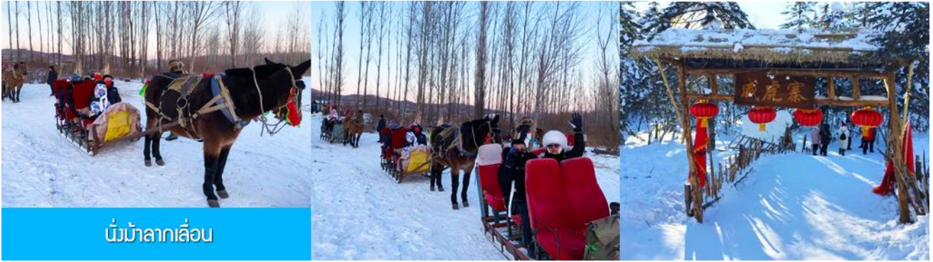
นั่งม้าลากเลื่อน