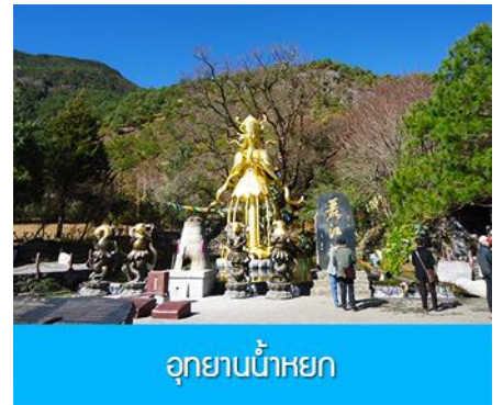
อุทยานน้ำหยก

วันที่ 1 ภูเขาหิมะมังกรหยก (รวมนั่งกระเช้าใหญ่ขึ้นลง)– หุบเขาพระจันทร์สีน้ำเงิน-น้ำตกไปสู่ยเหอ ออฟชั่น ไกด์ขายรถออล์ฟ ท่านละ 80 หยวน โชว์ IMPRESSION LIJIANG- อุทยานน้ำหยก -ต้าหลี่