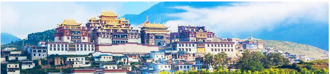
เมืองโบราณเซงกรี่ล่า

จากนั้นนำท่านชม หมู่บ้านซีโจวหรือหมู่บ้านชาวไป่ ชนพื้นเมืองที่สำคัญของเมือง ชมการแสดงของชนชาติปายพร้อมชิมชาสามแก้ว เพื่อรำลึกถึงวิถีชีวิตและการเกิดมาเป็นมนุษย์ของตนเอง ซึ่งถือเป็นเอกลักษณ์ของชนชาวไป่ ที่หาดูได้ยาก