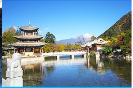
สระน้ำมังกรดำ