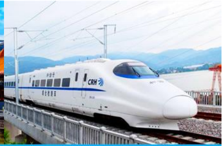
บั้งรถไฟความเร็วสูง