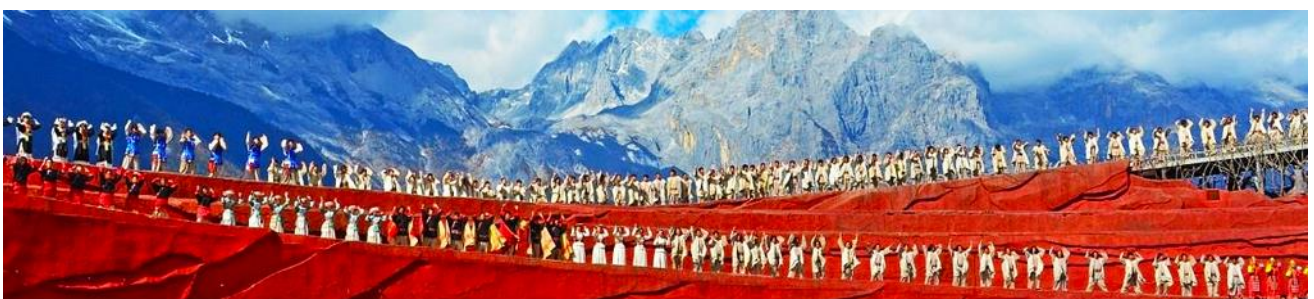
การแสดง IMPRESSION LIJIANG

หลังอาหารนำท่านชมการแสดง IMPRESSION LIJIANG โชว์อันยิ่งใหญ่โดยผู้กำกับชื่อก้องโลก “จาง อี้โหมว” ได้เนรมิต ให้ภูเขาหิมะมังกรหยกเป็นฉากหลัง และบริเวณทุ่งหญ้าเป็นเวทีการแสดง โดยใช้ นักแสดงกว่า 600 ชีวิต แสง สี เสียง การแต่งกายตระการตาเล่าเรื่องราวชีวิตความเป็นอยู่ และชาวเผ่าต่างๆ ของเมืองลี่เจียง