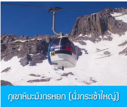
ภูเขาหิมะมังกรหยก (นั่งกระเช้าใหญ่)

ที่พัก FENG HUANG HOTEL ระดับ 4 ดาว หรือเทียบเท่าเมืองลี่เจียง