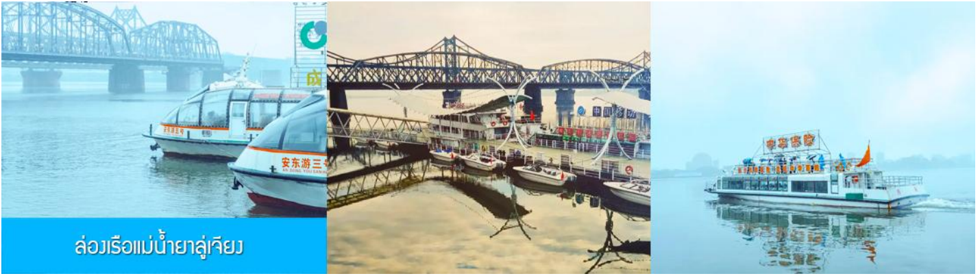
ล่องเรือแม่น้ำยาลู่เจียง

หลังอาหารให้ท่านพักผ่อนตามอัชฌาศัยในโรงแรม