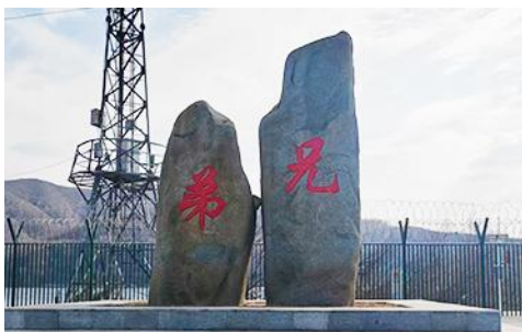
ป้ายพรมแดนจีนเกาหลีและแท่งศิลาสองพี่น้อง