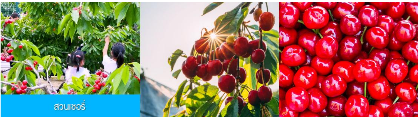
สวนเชอร์รี่

นำท่านสู่ สวนเชอร์รี่ 樱桃园现摘樱桃 ให้ท่านสัมผัสประสบการณ์สุดชิล ด้วยการเด็ดเชอร์รี่สดจากต้นภายในสวนเชอร์รี่ (เชอร์รี่ของเมืองนี้จะเริ่มสุกและเก็บได้ในช่วงปลายเดือนพฤษภาคม - มิถุนายนของทุกปี ในกรณีที่ผลเชอร์รี่น้อยหรือหมดเร็วกว่าปกติ ทางทัวร์ขอสงวนสิทธิ์ในการจัด โปรแกรมอื่นแทนการเด็ดเชอร์รี่)