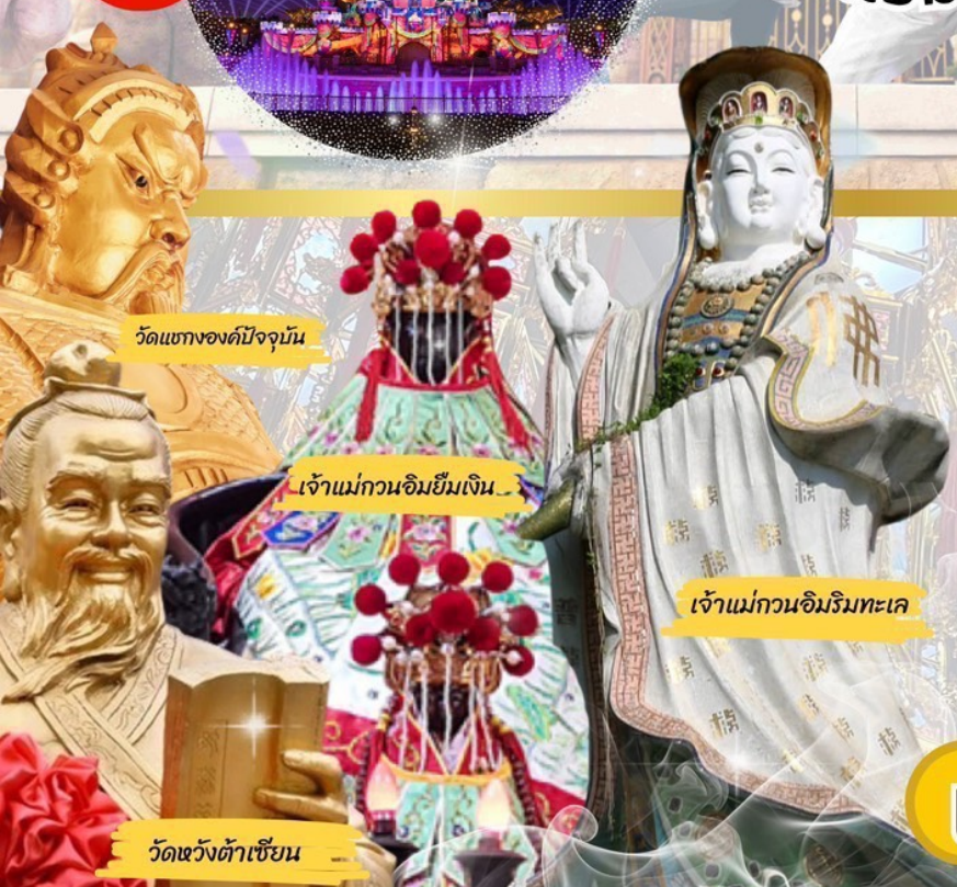
วัดแทงองค์ปัจจุบัน