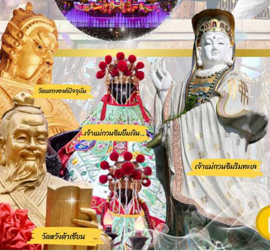
วัดแห่งองค์ปัจจุบัน