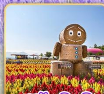
สวนซึกิไซโนะโอกะ