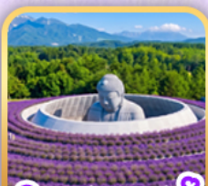
สวนซึกิโซโนะโอะกะ