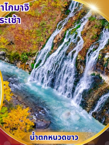
น้ำตกหมวดขาว

พักโรงแรม 3 ดาว ★★★★★ ฟรี ประกันอุบัติเหตุ บริการอาหารท้องถิ่น