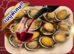
ซีฟู้ด เป้าอ้อ+ไอน์แดง