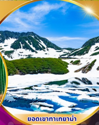
ยอดเขาทาเทยาม่า

พักรูแรม 3 ดาว ★★★★★ ฟรี ประกันอุบัติเหตุ บริการอาหารท้องถิ่น