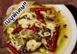
ปลาต้มพริกทอด