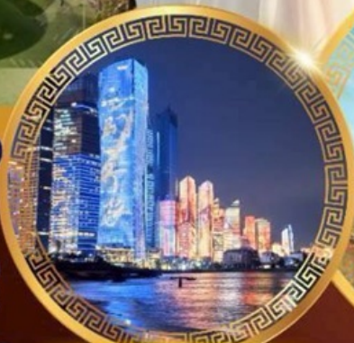
No.3 Bathing Beach

ลานจัดงานเบียร์ชิงเต่า Golden Beach ทางเดินไม้ริมทะเล ศาลเจ้าเทพทะเล ถนนคนเดินโตตง พิพิธภัณฑ์เทศบาลชิงเต่า สวนสาธารณะซิกแนลฮิลล์ ถนนหลงเจียงสู่ กระเช้าภูเขาไท่ผิง ยาน Da Bao Island โบสถ์ st.Michael's Cathedral ถนนจงชาน ถนนคนเดินฟิลาญยวน จัตุรัสเบียร์