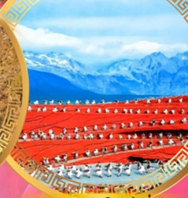
ความประทับใจแห่งลี่เจียง