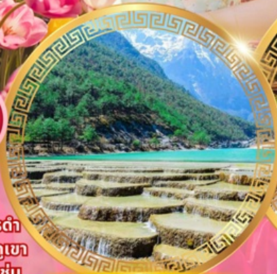
ทะเลสาบไป๋สยเหอ

เมืองโบราณคู่เสียง เมืองโบราณต้าหลี่ เจดีย์สามองค์ เมืองโบราณแสงกริลล่า วัดชงจ้านหลิน ช่องแคบเสือกะโจน สระมังกรดำ เมืองโบราณลีเจียง ภูเขาหิมะ มังกรหยก ชมวิวภูเขา หิมะที่ร้าน Yun di ta ชมดอกไม้ที่สวนอุทยานชุ่ม น้ำโกวหนาน ชมดอกซากุระสวนหยวนทง