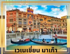
เวเนเชียน มาเก๊า