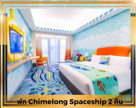
พัก Chimelong Spaceship 2 คืน

ช้อปปิ้งเดอะเวเนเชียน The Parisian The Londoner