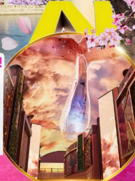
Aurora Media Art

ชมศิลปะดิจิทัลสุดล้ำ บนจอ LED เสมือนจริงขนาดยักษ์ อีสะระช้อปปิ้งย่านคังนัม คังนัม เมียงดง ฮงแด ซองซู ช้อปปลอดภาษี Lotte Duty Free