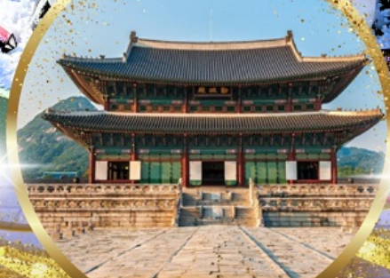
พระราชวังเคียงบกกรุง