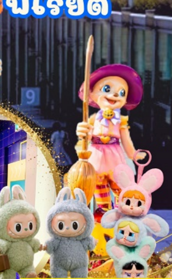
ชาว Art toy ห้าพลาต ตามล่าหา Labubu กับ PPG ที่โซล