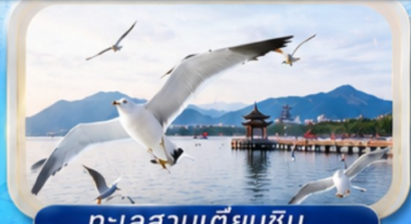
ทะเลสาบเตียนซิน