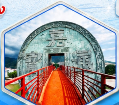
จตุรัสเหรียญโบราณ