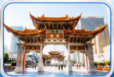
ประตูม้าทองโก่หยก