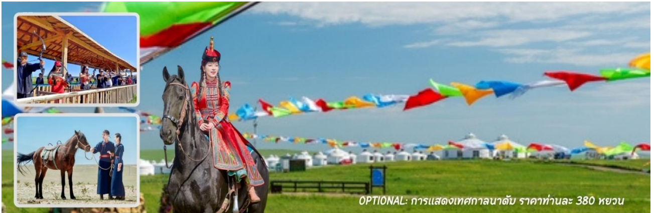
OPTIONAL: การแสดงเทศกาลนาดัม ราคาท่านละ 380 หยวน

หมายเหตุ : บางกิจกรรมอาจมีการเปลี่ยนแปลงโดยไม่ได้แจ้งให้ทราบล่วงหน้า ทั้งนี้ขึ้นอยู่กับสภาพภูมิอากาศในแต่ละปี รับประทานสอบถามกับทางไกด์ท้องถิ่น หรือหัวหน้าทัวร์ให้ละเอียดก่อนการตัดสินใจซื้อ