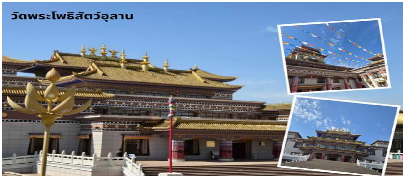
วัดพระโพธิสัตว์อุลาน

นำท่านสู่ร้านสินค้าพื้นเมืองร้านเครื่องเงิน นำท่านสู่ วัดพระโพธิสัตว์อุลาน เป็นสถานที่ท่องเที่ยวระดับ 4A ครอบคลุมพื้นที่ประมาณ 20,000 ตารางเมตร รูปแบบอาคารเป็นสถาปัตยกรรมแบบผสมผสานมองโกล ทิเบต และฮั่น ภายในมีการจัดแสดงโบราณวัตถุทางวัฒนธรรมที่ยังคงมีความสมบูรณ์