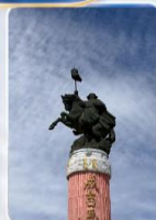
สวนสุสานเจงกิสข่าน (ชมด้านนอก)