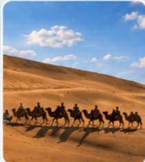
ทะเลทรายเสี่ยงชวาน (รวมกระเช้า+ขี่อูฐ)