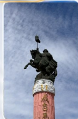
สวนสุสานเจงกิสข่าน (ชมด้านนอก)