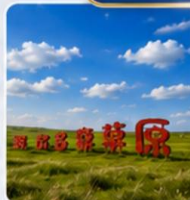
ทุ่งหญ้าออร์ดอส พิพิธภัณฑ์แบบชาวมองโกเลีย สวนซูดมองโกเลีย ป่าที่ร้อนกึ่งไฟ