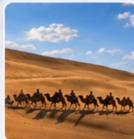
ทะเลทรายเสียงซาวาน (รวมกระเช้า+ขี่อูฐ)