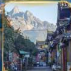
เมืองโบราณซูเหอ