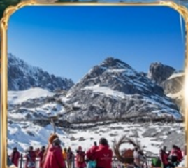
ภูเขาหิมะมังกรหยก +กระเช้าใหญ่