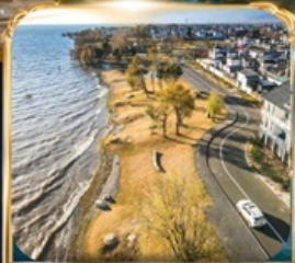
ทะเลสาบเอ่อไห่ โค้งตัว S