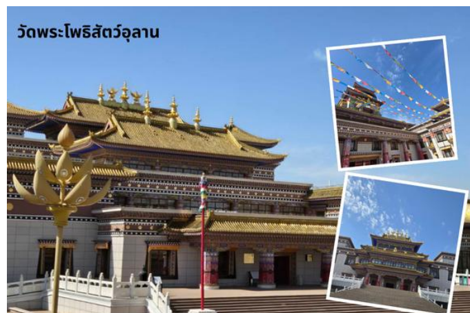
วัดพระโพธิสัตว์อุลาน

นำท่านสู่ วัดพระโพธิสัตว์อุลาน เป็นสถานที่ท่องเที่ยวระดับ 4A ครอบคลุมพื้นที่ประมาณ 20,000 ตารางเมตร รูปแบบอาคารเป็นสถาปัตยกรรมแบบผสมผสานมองโกลทิเบต และฮั่น ภายในมีการจัดแสดงโบราณวัตถุทางวัฒนธรรมที่ยังคงมีความสมบูรณ์