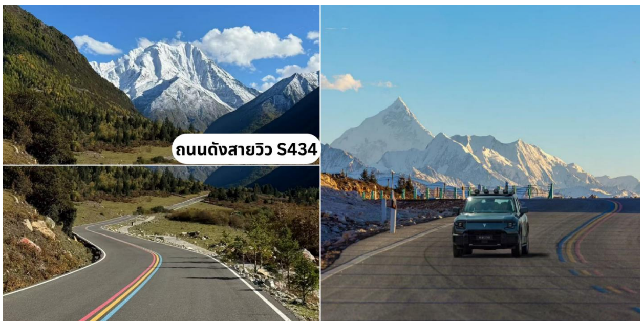
ถนนดั่งสายวิว S434

จากนั้นนำท่านเดินทางสู่ ถนนดั่งสายวิว S434 机场路 (เส้น 434 ถนน Airport) หรืออีกชื่อคือถนนสายรุ้ง เป็นเส้นทางระหว่างคังตังไป ซินตูเจียว (ทางไปHonghaizi และ Yuzixi) เป็นเส้นทางที่สวยงามและที่นิยมอีกที่หนึ่ง เต็มไปด้วยวิวภูเขา และวิวธรรมชาติตลอด 2 ฝั่งทาง