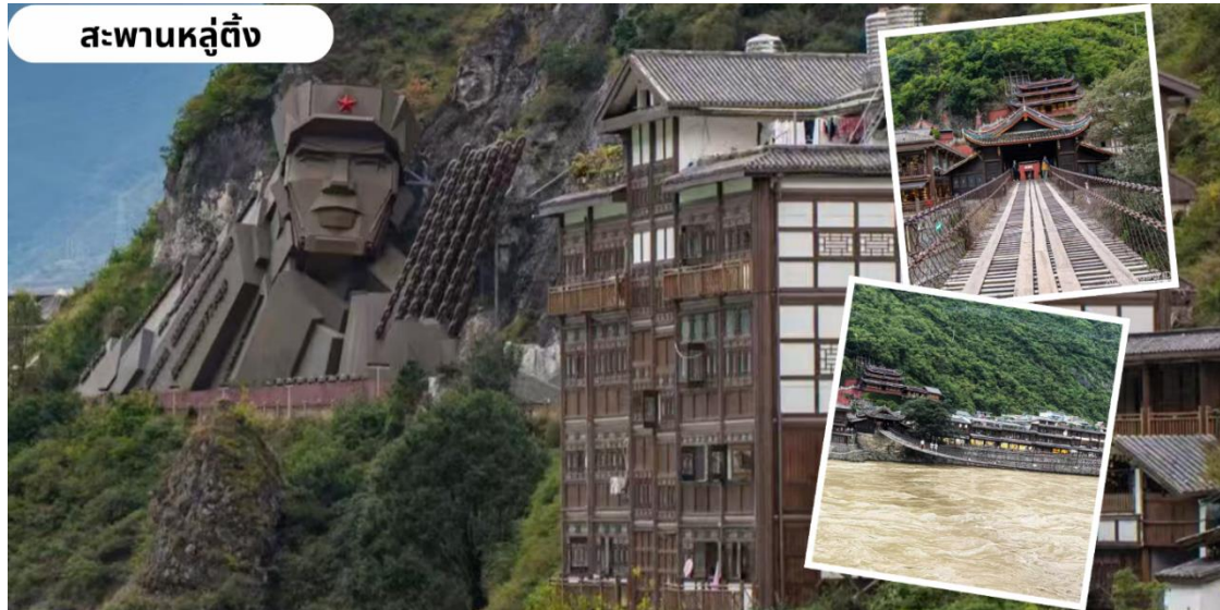
สะพานหลู่ตึง

จากนั้นนำท่านเดินทางสู่ สะพานหลู่ตึง เป็นสะพานโซ่เหล็กโบราณในมณฑลเสฉวน สร้างขึ้นในปี ค.ศ. 1705 ขตปกครองตนเองทิเบตกาฉี๋ มณฑลเสฉวน เป็นสะพานประวัติศาสตร์ที่สร้างขึ้นตั้งแต่ปี ค.ศ. 1705 ในสมัยจักรพรรดิคังซีแห่งราชวงศ์ชิง เพื่อข้ามแม่น้ำต้าตู้ (Dadu River, 大渡河) มีความยาวกว่า 100 เมตร กว้าง 3 เมตร สะพานแห่งนี้กลายเป็นจุดเปลี่ยนสำคัญในประวัติศาสตร์จีน เมื่อปี 1935 ได้เป็นจุดยุทธศาสตร์ที่กองทัพแดง นำโดยผู้นำสามคน หนึ่งในนั้นคือ เหมาเจ๋อตง ต่อสู้กับกองทัพของเจียงไคเช็คอย่างดุเดือด นั่นจึงทำให้สะพานหลู่ตึงได้กลายเป็นอนุสรณ์สถานทางประวัติศาสตร์ที่สำคัญของพรรคคอมมิวนิสต์จีน