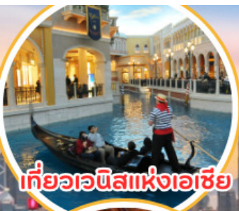
เที่ยวเวนิสแห่งเอเชีย