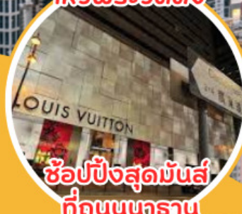
ช้อปปิ้งสุดมันส์ ที่ถนนนคราณ