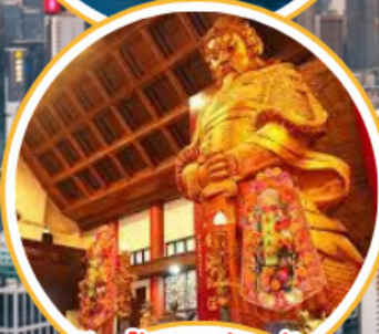
ไหว้พระวัดดัง