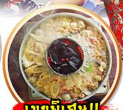
เมฆหมอกพิเศษ!!