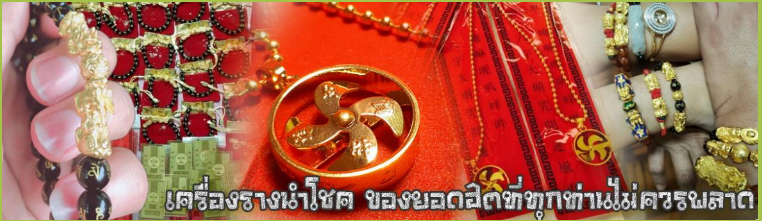
เครื่องรางนำโชค ของยอดฮิตที่ทุกท่านไม่ควรพลาด

จากนั้นนำท่านสู่ ร้านหยก ชมความงามปีเซียะ ที่เชื่อกันว่าเป็นวัดคุ้มครองลยอนิยม ที่มีการนำมาบูชา เพื่อให้ช่วยป้องกันสิ่งชั่วร้าย เรียกทรัพย์สินเงินทองให้ไหลมาเทมา และกักเก็บทรัพย์นั้นไม่ให้รั่วไหลออกไปไหนได้ ชาวจีนโบราณเชื่อกันว่า ปีเซียะเป็นสัตว์ประหลาดที่รวมลักษณะของสัตว์มงคลทั้ง 5 ชนิดไว้ด้วยกัน ได้แก่ มังกร พญาราชสีห์หรือสิงโต, อินทรี, กวาง, และแมว โดยตามตำนานเล่าว่า ปีเซียะเป็นลูกมังกรตัวที่ 9 (เทพแห่งโชคลาภ) ของพญามังกรสวรรค์ มีชื่อเรียกด้วยกันหลายชื่อไม่ว่าจะเป็น “เทียนลก (กวางสวรรค์)” เป็นชื่อเดิม ส่วนจีนกวางตุ้งจะเรียกว่า “เผ่ย้า” และคนจีนแต้จิ๋วจะเรียกว่า “ผีชีว” และ ยังมีจำหน่ายยาสมุนไพรบำรุงเพิ่มความแข็งแรงตามความเชื่อของคนฮ่องกง