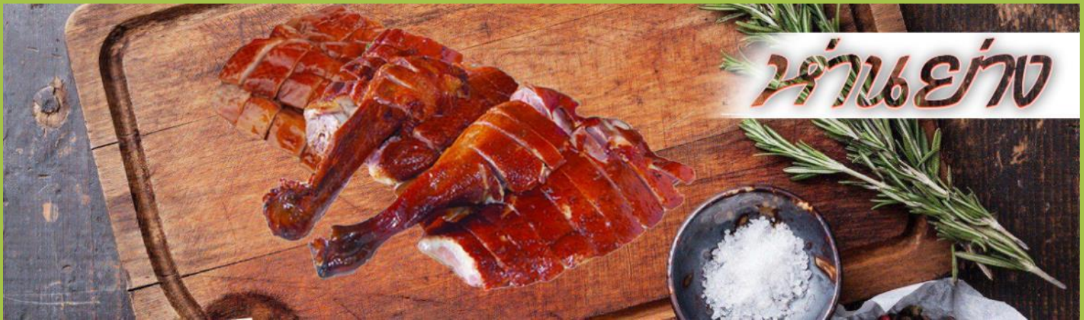
ร้านเย่าง

เที่ยง รับประทานอาหาร ณ กัสดาคาร ****เมนูท่านอย่างต้นตำหรับฮ่องกงแสนอร่อย****