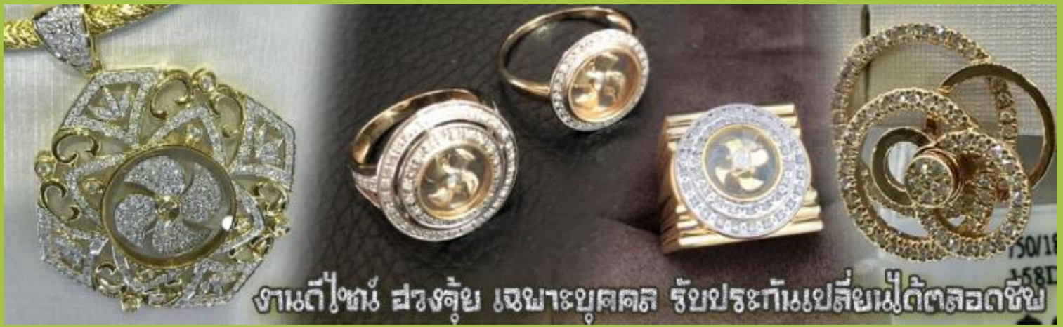
งานตีทอง ฝังจัญเจษาะบุคคล รับประกันเปลี่ยนไม่ตัดลดซ้ำ

จากนั้นนำท่านสู่ ร้านหยก ชมความงามปีเซียะ ที่เชื่อกันว่าเป็นวัตถุมงคลยอดเยี่ยม ที่มีการนำมาบูชา เพื่อให้ช่วยป้องกันสิ่งชั่วร้าย เรียกทรัพย์สินเงินทองให้ไหลมาเทมา และกักเก็บทรัพย์นั้นไม่ให้รั่วไหลออกไปไหนได้ ชาวจีนโบราณเชื่อกันว่า ปีเซียะเป็นสัตว์ประหลาดที่รวมลักษณะของสัตว์มงคลทั้ง 5 ชนิดไว้ด้วยกัน ได้แก่ มังกร พญาราชสีห์หรือสิงโต, อินทรี, กวาง, และแมว โดยตามตำนานเล่าว่า ปีเซียะเป็นลูกมังกรตัวที่ 9 (เทพแห่งโชคลาภ) ของพญามังกรสวรรค์ มีชื่อเรียกด้วยกันหลายชื่อไม่ว่าจะเป็น “เทียนลก (กวางสวรรค์)” เป็นชื่อเดิม ส่วนจีนกวางตุ้งจะเรียกว่า “เผ่ย้า” และคนจีนแต้จิ๋วจะเรียกว่า “ผิวซิว” และ ยังมีจำหน่ายยาสมุนไพรบำรุงเพิ่มความแข็งแรงตามความเชื่อของคนฮ่องกง