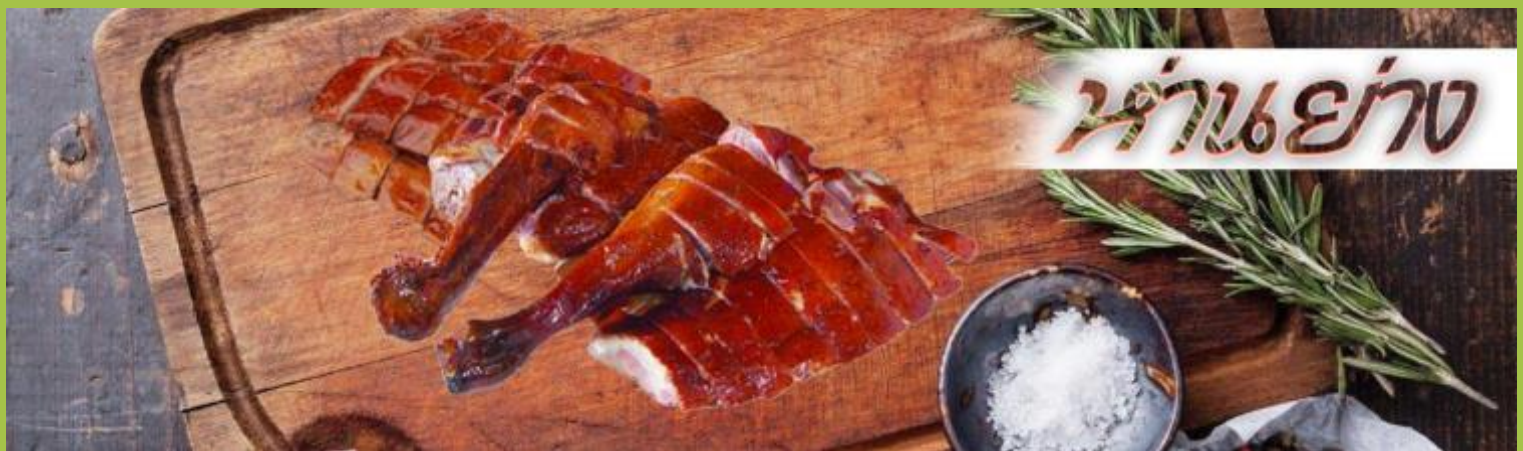
ห่านย่าง

เที่ยง รับประทานอาหาร ณ กัตตาดาร ****เมนูท่านอย่างต้นตำหรับฮ่องกงแสนอร่อย****