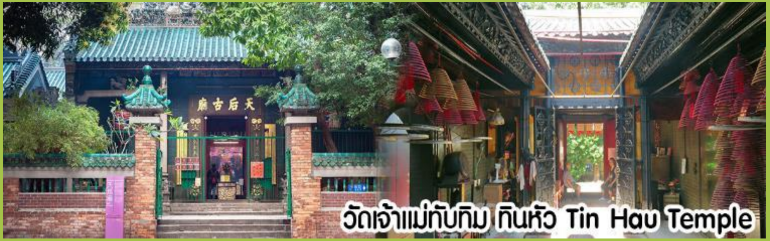
วัดเจ้าแม่ทับทิม ทินหัว Tin Hau Temple