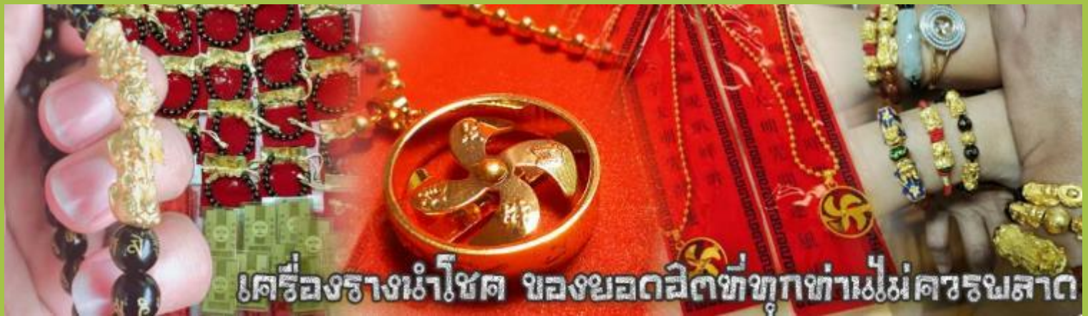
เครื่องรางนำโชค ของยอดฮิตที่ทุกท่านไม่ควรพลาด

จากนั้นนำท่านสู่ ร้านหยก ชมความงามปีเซียะ ที่เชื่อกันว่าเป็นวัตถุมงคลยอดเยี่ยม ที่มีการนำมาบูชา เพื่อให้ช่วยป้องกันสิ่งชั่วร้าย เรียกทรัพย์สินเงินทองให้ไหลมาเทมา และกักเก็บทรัพย์นั้นไม่ให้รั่วไหลออกไปไหนได้ ชาวจีนโบราณเชื่อกันว่า ปีเซียะเป็นสัตว์ประหลาดที่รวมลักษณะของสัตว์มงคลทั้ง 5 ชนิดไว้ด้วยกัน ได้แก่ มังกร พญาราชสีห์หรือสิงโต, อินทรี, กวาง, และแมว โดยตามตำนานเล่าว่า ปีเซียะเป็นลูกมังกรตัวที่ 9 (เทพแห่งโชคลาภ) ของพญามังกรสวรรค์ มีชื่อเรียกด้วยกันหลายชื่อไม่ว่าจะเป็น “เทียนลก (กวางสวรรค์)” เป็นชื่อเดิม ส่วนจีนกวางตุ้งจะเรียกว่า “เผ่ย้า” และคนจีนแต้จิ๋วจะเรียกว่า “ผิวซิว” และ ยังมีจำหน่ายยาสมุนไพรบำรุงเพิ่มความแข็งแรงตามความเชื่อของคนฮ่องกง