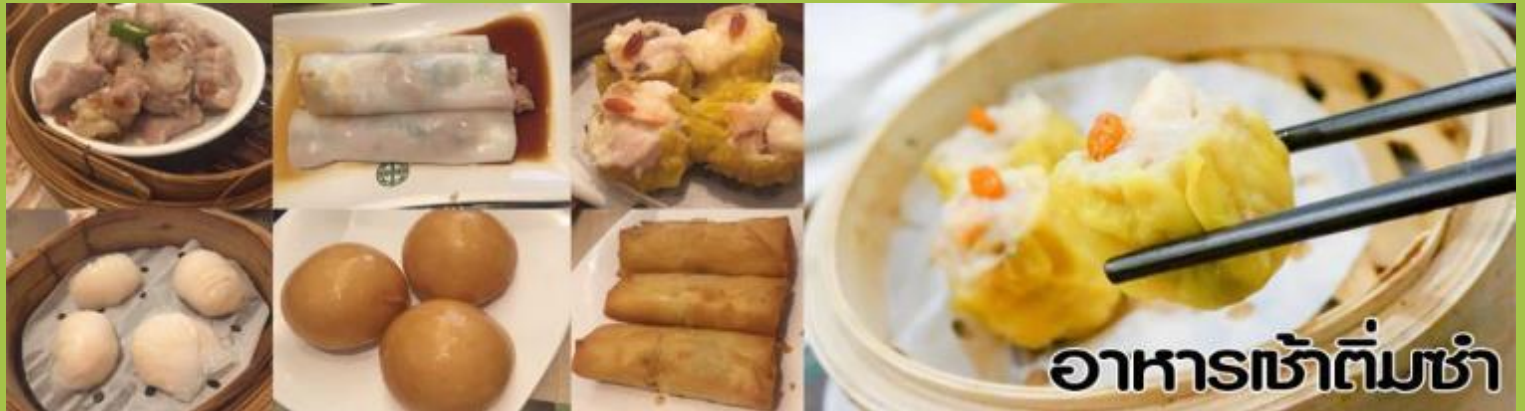
อาหารเช้าต้มซ่า

เช้า รับประทานอาหารเช้า (ต้มซ่า) ณ กั๊ดตาดาร