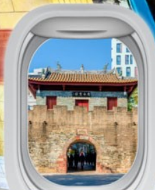
เมืองโบราณหนาวโก