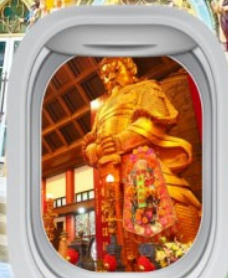
วัดเซกทหิว