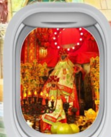
วัดเจ้าแม่กวนอิมสองฮ่า