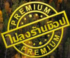
หาดห้าสี