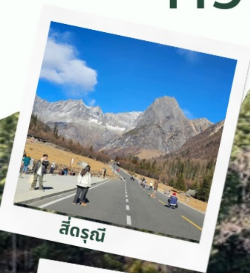
สี่ดรุณี