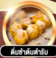
ต้มซ่าคั้นตำรับ