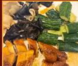
ไก่ แดงกวา เห็ดหูหนู