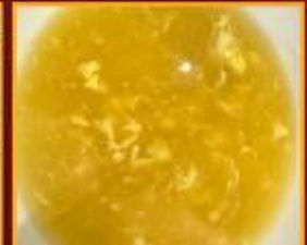
ซูปข้าวโพด