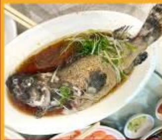
ปลาหนึ่งซีอิ้ว