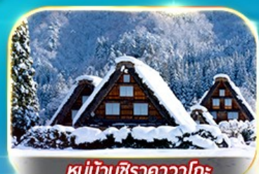
หมู่บ้านชิราคาวาโกะ

ชมความงามของปราสาทโอซาก้า ถ่ายรูปเช็คอินป้ายกูลิโกะที่ซันโซมาชิ หมู่บ้านชิราคาวาโกะ วัดคิโยมิจิ วัดโทไดจิ ซันมาชิ ซูจิ