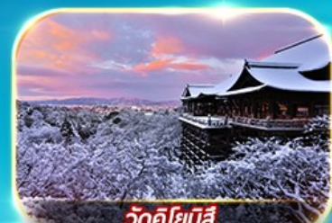
วัดคิโยมิจิ