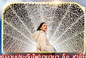
ชมงานประดับไฟนากาโน่ โนะ ซาโตะ