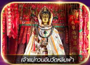
เจ้าแม่ทวนอิมวัดหลินฟ้า

เต็มอิ่มทั้งบุญ และ ซอปปิงแบบจัดเต็ม จิมซาจุ่ย มงก๊ก