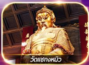
วัดเซกกงหมิว