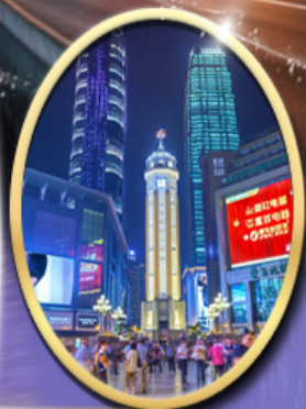
ถนนคนเดินเจียฟางเป็ย