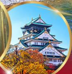
วัดคิโยมิจิ