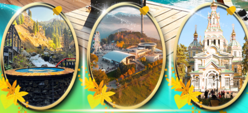
Alma Arasan Gorge Kok Tobe Zenkov Cathedral

เที่ยวครบทุกไฮไลท์ กรุ๊ป 15 ท่าน ไฮไลท์ พิเศษ! พักโคลโซ 1 คืน พักอัลมาตี 3 คืน