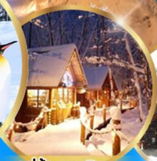
หมู่บ้านเทพนิยาย นิงเกิลทอเรส