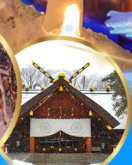
ศาลเจ้า ออกโทโต

เดินทาง 04 - 09 กุมภาพันธ์ 68 05 - 10 กุมภาพันธ์ 68