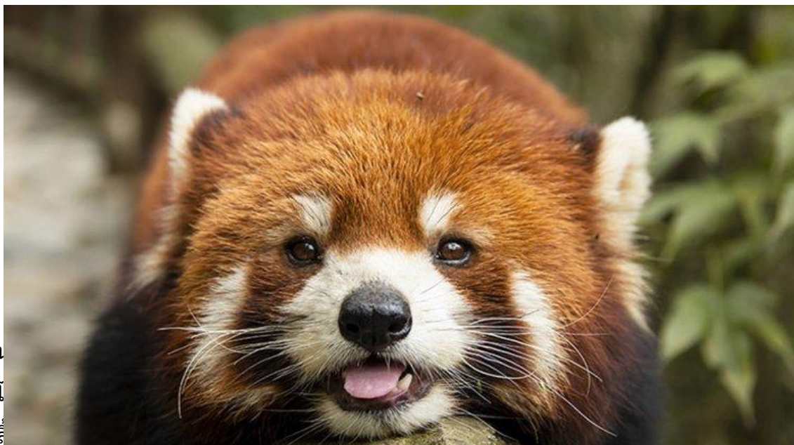
ชลประทาน ที่ไม่มีที่